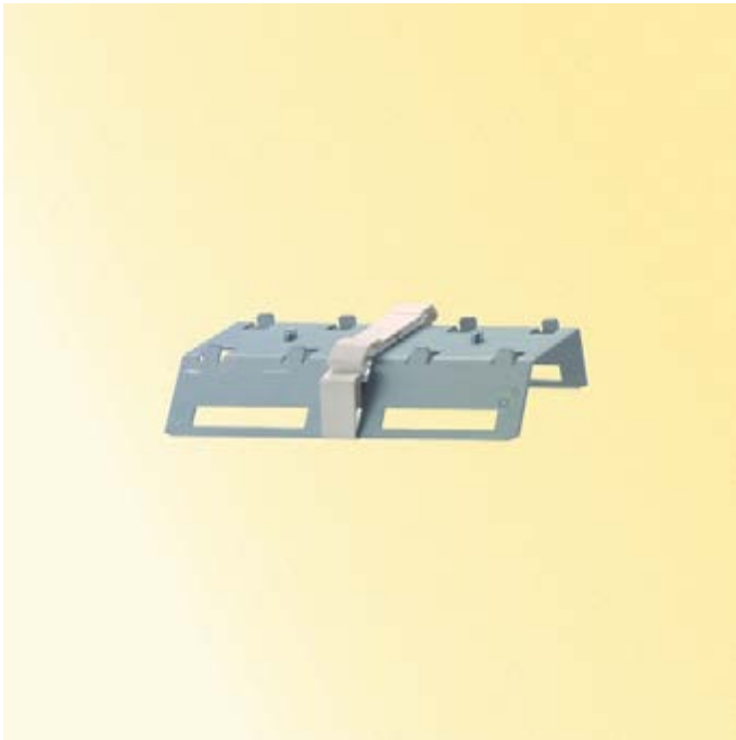
Gehäuse: Verbinder IP50