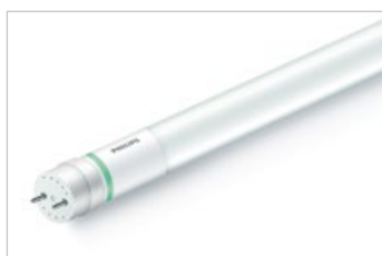
MASTER LEDtube Value 1500mm UO 24W 840 T8 Glas Bestell-Nr.: 647 056 00 1200mm UO 16W 840 T8 Glas Bestell-Nr.: 646 998 00