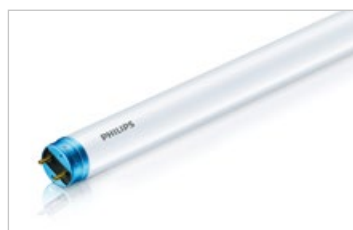
CorePro LEDtube 1500mm 20W 840 T8 Glas Bestell-Nr.: 710 913 00 1200mm 14,5W 840 T8 Glas Bestell-Nr.: 711 071 00