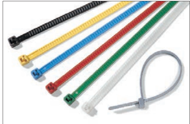
Die Kabelbinder der LR55-Serie eignen sich zur farblichen Kennzeichnung und sind wiederverwendbar.