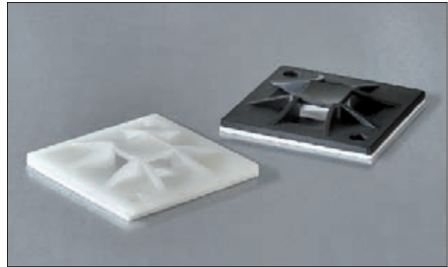
Q-mount 4-Wege-Montagesockel QM schraubbar und QMA selbstklebend.

Weitere Systemlösungen der Q-Serie finden Sie auf den Seiten 78 und 256.