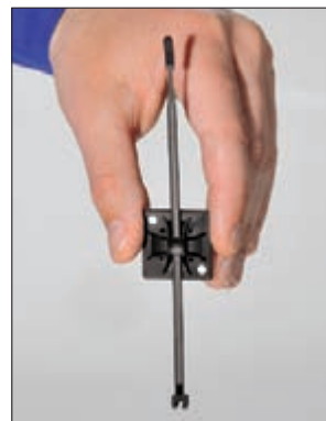
Der Q-mount Montagesockel fixiert den Q-tie Kabelbinder sogar in vertikaler Position - das vereinfacht die Montage!