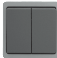
Serienschalter 10 A, 250 V~, mit schraubenlosem Steckanschluss