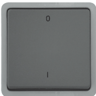
Ausschalter 10 A, 250 V~, 2-polig, mit 0+1, mit schraubenlosem Steckanschluss