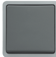
Kreuzschalter 10 A, 250 V~, mit schraubenlosem Steckanschluss