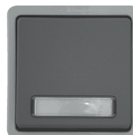
Universalschalter 10 A, 250 V~, Aus-/Wechsel, mit Schraubanschluss, mit Beschriftungsfeld und Papierstreifen