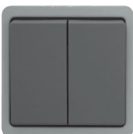
Doppelwechschler 10 A, 250 V~, mit Schraubanschluss