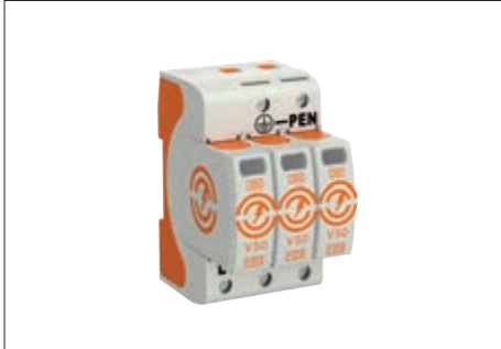
Blitzstrom- Kombiableiter Typ 1+2