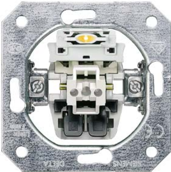
DELTA SCHALTER-GERÄTEEINSATZ UP, KONROLLSCHALTER AUS 10A 250V