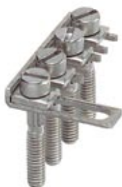
Schaltbrücke, Rastermaß: 8,2 mm, Polzahl: 4, Farbe: silberfarben

Bitte beachten Sie, dass die hier angegebenen Daten dem Online-Katalog entnommen sind. Die vollständigen Informationen und Daten entnehmen Sie bitte der Anwenderdokumentation. Es gelten die Allgemeinen Nutzungsbedingungen für Internet-Downloads. ( http://phoenixcontact.de/download )