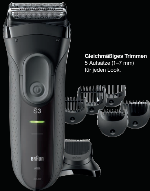
Gleichmäßiges Trimmen 5 Aufsätze (1–7 mm) für jeden Look.

Gründliche Rasur, perfekter Hautkomfort. Schneller als je zuvor.*