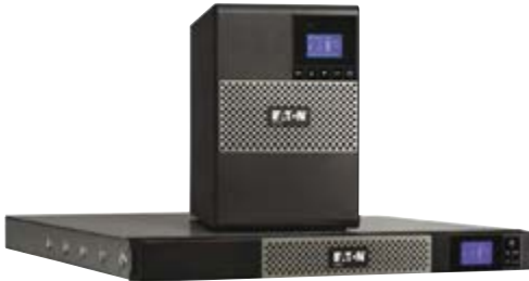
Als Tower- und als 1HE-Rackversion erhältlich