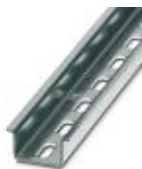
Tragschiene 35 mm (NS 35)

Tragschiene gelocht - NS 35/15 WH PERF 2000MM - 0806602