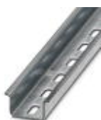
Tragschiene, Material: verzinkt, gelocht, Höhe 15 mm, Breite 35 mm, Länge: 2 m

Tragschiene gelocht - NS 35/15 ZN PERF 2000MM - 1206599