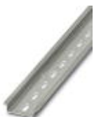
Tragschiene, Material: Stahl verzinkt und dickschichtpassiviert, gelocht, Höhe 7,5 mm, Breite 35 mm, Länge: 2000 mm

Tragschiene gelocht - NS 35/ 7,5 PERF 2000MM - 0801733