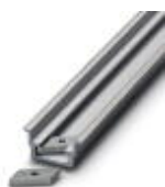
Tragschiene, profil-gezogen, hohe Ausführung, ungelocht 1,5 mm dick, Material: Aluminium, Höhe 15 mm, Breite 35 mm, Länge 2000 mm

Tragschiene ungelocht - NS 35/15 AL UNPERF 2000MM - 1201756