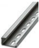
G-Profil-Tragschiene, Material: Stahl, gelocht, Höhe 15 mm, Breite 32 mm, Länge 2 m

Tragschiene gelocht - NS 32 PERF 2000MM - 1201002