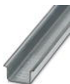
Tragschiene, Material: verzinkt, ungelocht, Höhe 15 mm, Breite 35 mm, Länge: 2 m

Tragschiene ungelocht - NS 35/15 ZN UNPERF 2000MM - 1206586