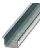
Tragschiene 35 mm (NS 35)

Tragschiene - NS 35/15 WH UNPERF 2000MM - 1204135