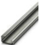
G-Profil-Tragschiene, Material: Stahl, ungelocht, Höhe 15 mm, Breite 32 mm, Länge 2 m

Tragschiene ungelocht - NS 32 UNPERF 2000MM - 1201015