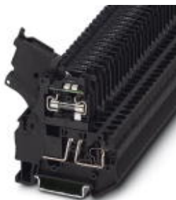
Hebel-Sicherungsklemme, Farbe schwarz, für 5 x 20 mm G-Sicherungseinsätze, mit LED für 24 V DC

Bitte beachten Sie, dass die hier angegebenen Daten dem Online-Katalog entnommen sind. Die vollständigen Informationen und Daten entnehmen Sie bitte der Anwenderdokumentation. Es gelten die Allgemeinen Nutzungsbedingungen für Internet-Downloads. ( http://phoenixcontact.de/download )