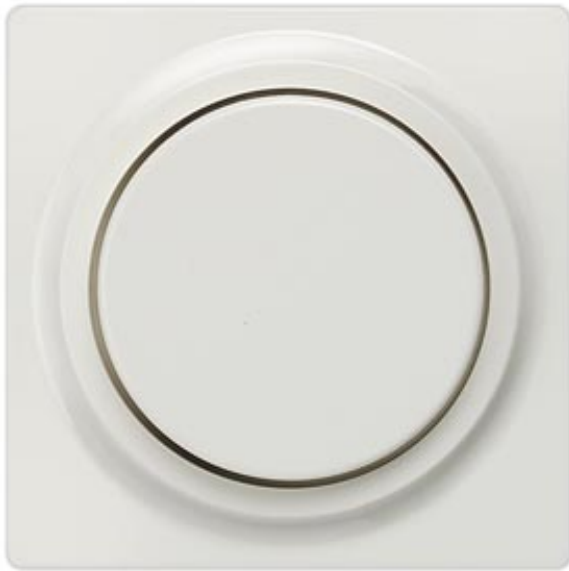
I-SYSTEM, TITANWEISS ABDECKPLATTE FUER DIMMER MIT DREHKNOPF 55X55MM