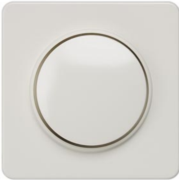
DELTA PROFIL, TITANWEISS ABDECKPLATTE FUER DIMMER MIT DREHKNOPF 65X65MM