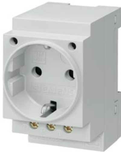
SCHUKOSTECKDOSE 16A NACH DIN VDE 0620 FUER VERTEILEREINBAU