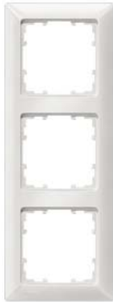
DELTA LINE, TITANWEISS RAHMEN, 3-FACH, 222X80MM