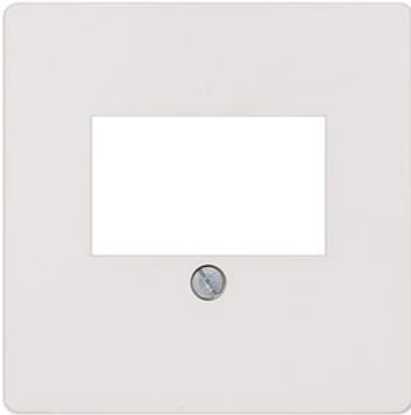
I-SYSTEM ABDECKPLATTE 55X55MM FUER TAE-ANSCHLUSSDOSE UND LAUTSPRECHERANSCHLUSSDOSE TITANWEISS