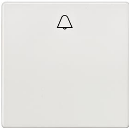
I-SYSTEM, TITANWEISS WIPPE MIT SYMBOL GLOCKE FUER TASTER, 55X55MM