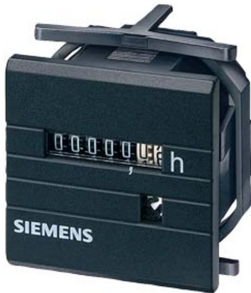
ZEITZAEHLER 48X48MM AC 230V 50HZ OHNE BLENDE 55X55MM