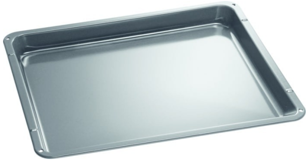
Brat- und Fettpfanne (BxTxH: 46,2 x 38,5 x 4,2 cm)