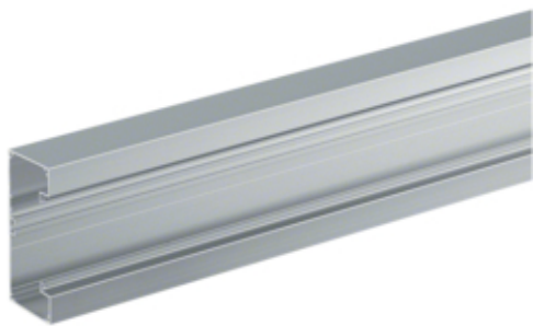
tehalit.BRAP Brüstungskanal Aluminium Unterteil 65x130mm, natureloxiert