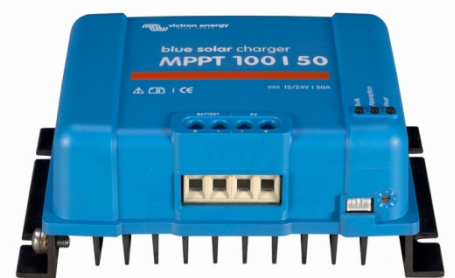
Solar-Laderegler MPPT 100/50