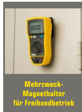
Mehrzweck-Magnethalter für Freihandbetrieb