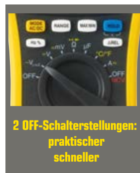
2 OFF-Schalterstellungen: praktischer schneller