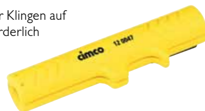
CIMCO-Artikelnr. 12 0047