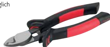
CIMCO-Artikelnr. 12 0108