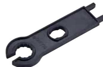
CIMCO-Artikelnr. 18 0004