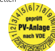
CIMCO-Artikelnr. 18 2701 (2023)