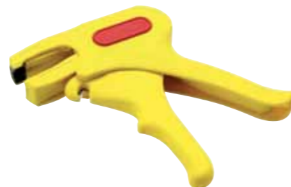
CIMCO-Artikelnr. 10 0774