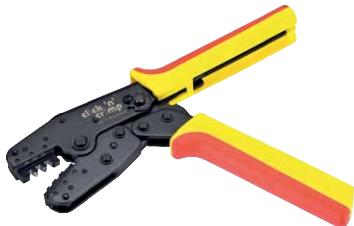
CIMCO-Artikelnr. 10 6034