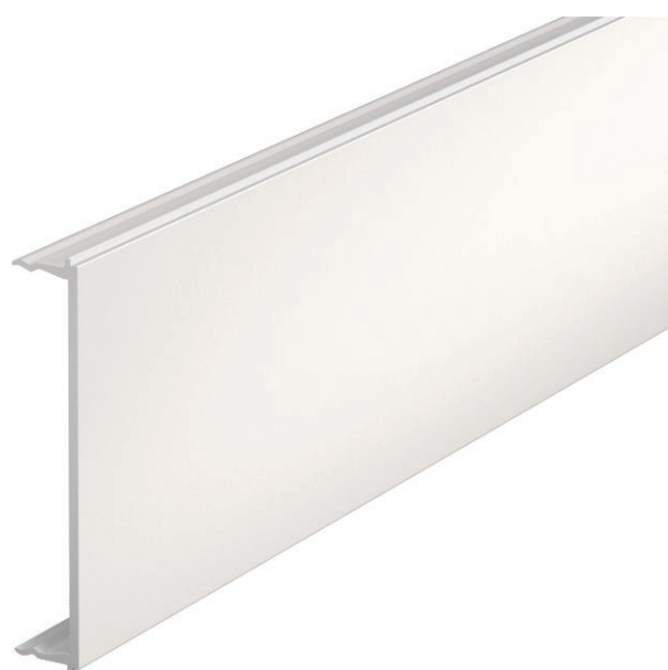
Oberteil zum Verschließen des Brüstungskanals SIGNA BASE.