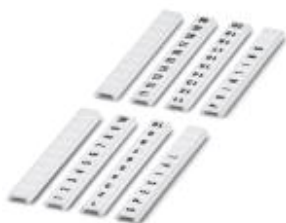
Zackband flach, 10-teilig, längs bedruckt mit den fortlaufenden Zahlen: 91 ... 100, weiß

Bitte beachten Sie, dass die hier angegebenen Daten dem Online-Katalog entnommen sind. Die vollständigen Informationen und Daten entnehmen Sie bitte der Anwenderdokumentation. Es gelten die Allgemeinen Nutzungsbedingungen für Internet-Downloads. ( http://phoenixcontact.de/download )