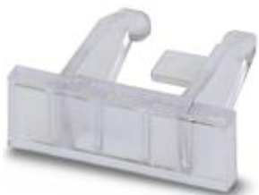
Klemmenleistenmarker, zur Leistenkennzeichnung, aufrastbar auf Endhalter E/UK oder CLIPFIX 35, Schriftfeldgröße: 25 x 6 mm

Bitte beachten Sie, dass die hier angegebenen Daten dem Online-Katalog entnommen sind. Die vollständigen Informationen und Daten entnehmen Sie bitte der Anwenderdokumentation. Es gelten die Allgemeinen Nutzungsbedingungen für Internet-Downloads. ( http://phoenixcontact.de/download )