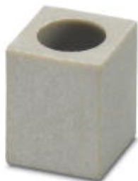
Brückenisoliersteg, Farbe: grau

Bitte beachten Sie, dass die hier angegebenen Daten dem Online-Katalog entnommen sind. Die vollständigen Informationen und Daten entnehmen Sie bitte der Anwenderdokumentation. Es gelten die Allgemeinen Nutzungsbedingungen für Internet-Downloads. ( http://phoenixcontact.de/download )