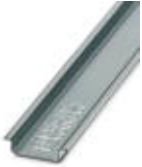
Tragschiene 35 mm (NS 35)

Tragschiene - NS 35/ 7,5 WH UNPERF 2000MM - 1204122