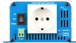
Phoenix Inverter 12/180 with Schuko socket