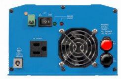
Phoenix Inverter 12/800 with Nema 5-15R socket