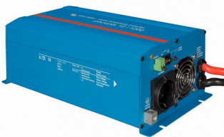
Phoenix Inverter 12/800 with Schuko socket