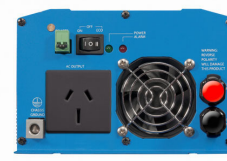
Phoenix Inverter 12/800 with AN/NZS 3112 socket