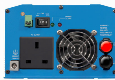
Phoenix Inverter 12/800 with BS 1363 socket