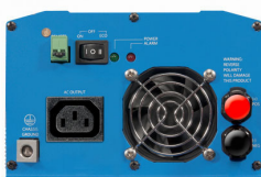
Phoenix Inverter 12/800 with IEC-320 socket