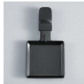
Inkl. 8 Raclette-Pfännchen mit Antihftbeschichtung.