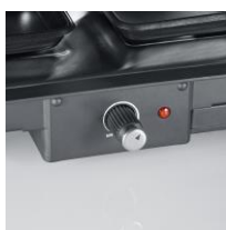
Regelbarer Thermostat und Kontrollleuchte.