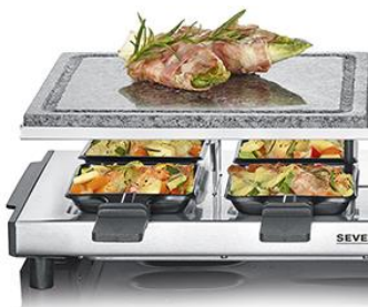
Naturgrillstein für besonders lange Wärmespeicherung.