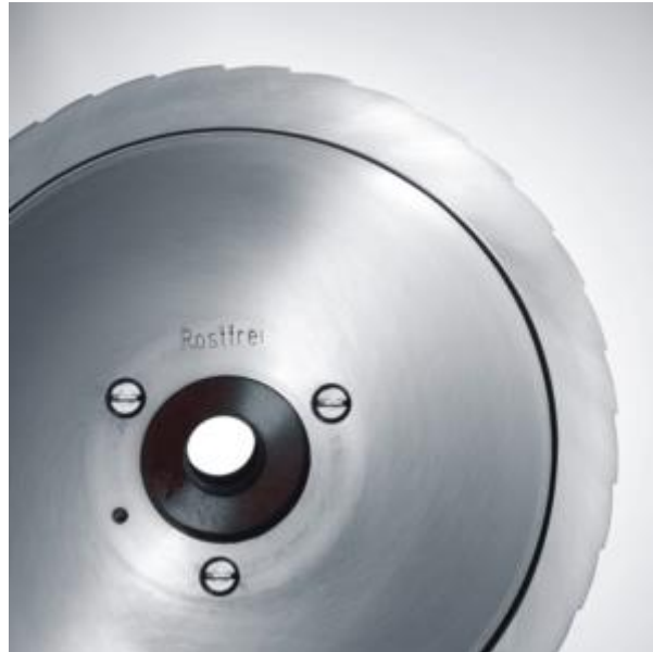
GRAEF Spezialmesser "Vollstahl" Art.Nr. 1731008

Messer aus rostfreiem Spezialstahl mit gezahnter Schneide und Hohlschliff in Gewerbemaschinenqualität, Durchmesser: Ø 170 mm