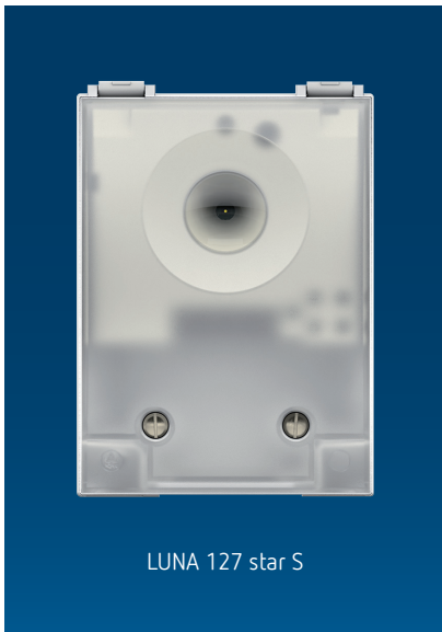
LUNA 127 star S